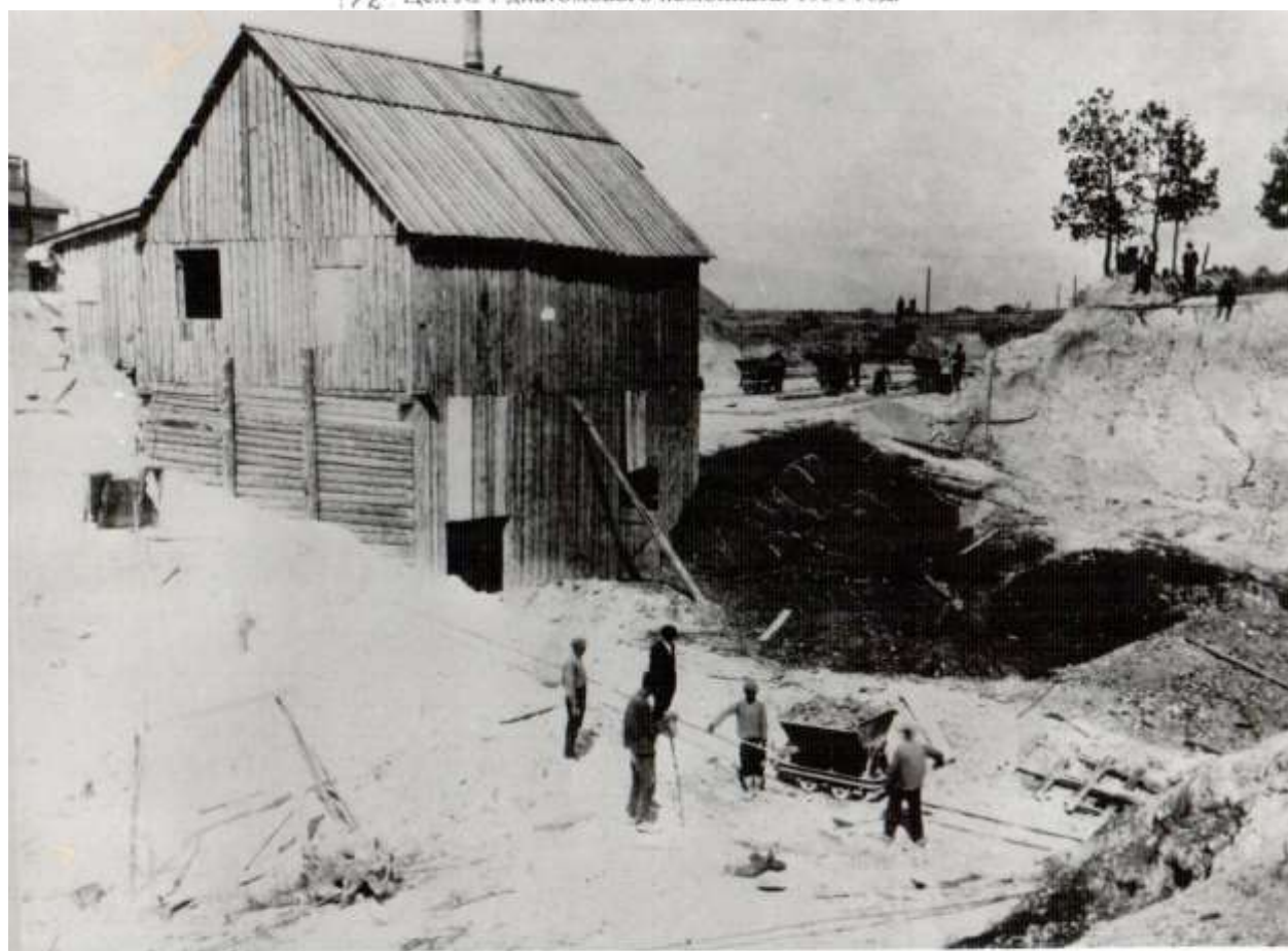
41. Карьер завода № 2 Диатомового комбината, 1932 год.