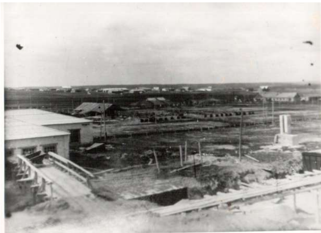
172. Цех № 1 диатомового комбината, 1951 год.