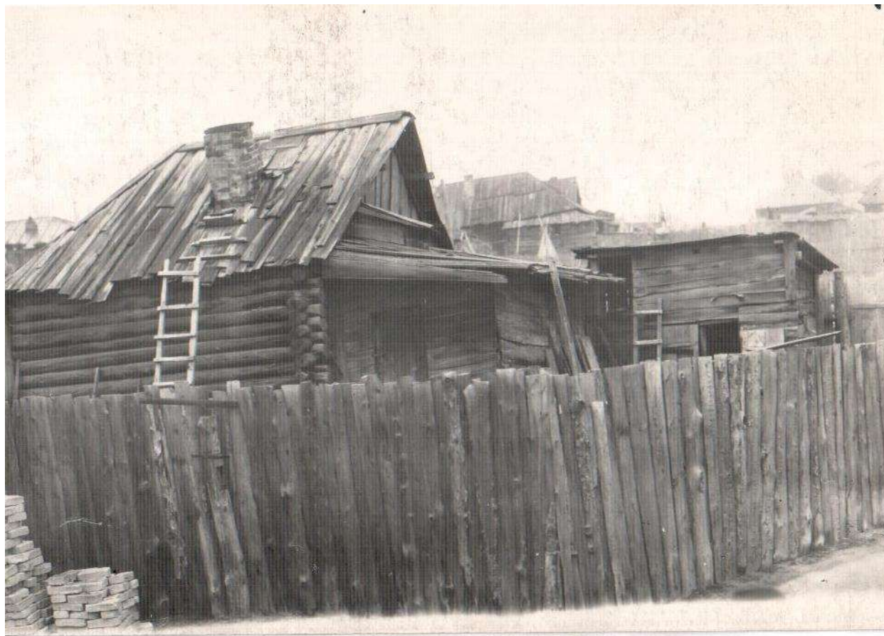
Один из первых домов, построенных в г. Инза.

Ратем появились жилые дома для железнодорожных служащих, постройки для хранения грузов и других целей. Постепенно пристраивались в ряд дома простых людей