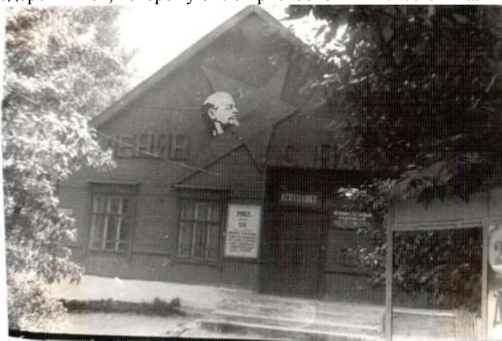
Железнодорожный клуб. 1982 год.

... Формы культурно-массовой работы партийных, комсомольских и профсоюзных организаций отличались большим разнообразием на железнодорожном узле станции. В 1920 году был построен клуб железнодорожников, которому было присвоено имя В.И. Ленина.