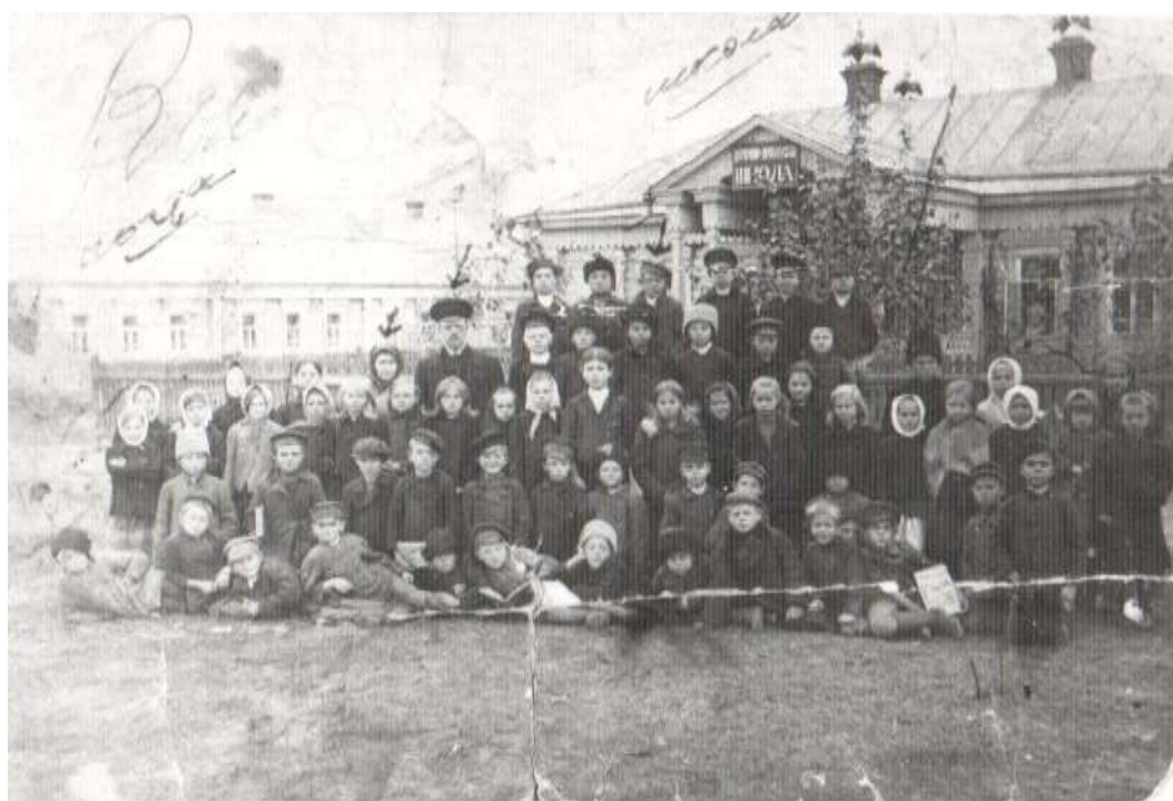
31. Общий вид церковно-приходской школы на станции Инза.

К 1913 году дворов при станции Инза насчитывалось восемь. Жильцов в них – 48 человек. При станции появились первые лавки, жандармерия. В частном доме была открыта церковно-приходская школа.